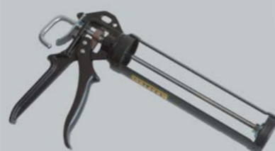
Пистолет под клей