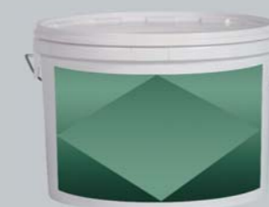
Мелкозернистая водорастворимая шпатлевка